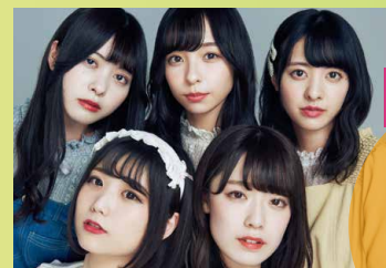
神宿 原宿発アイドルユニット