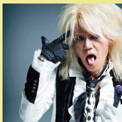
森重樹一 ZIGGYのボーカリスト