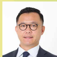
塚本堅一 元NHKアナウンサー