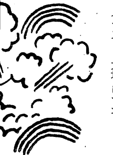
イラスト・大塚いちお

くなっていたという。怒りというのは、不当なことをされたという判断から生まれる。電話をした人たちは、病院が対策をしていなかったに違いないと考えたのかも知れない。クラスターが院外に広がり、自分