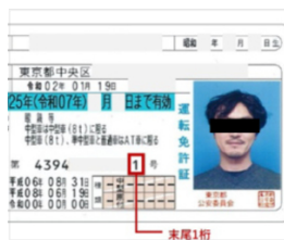
恐ろしい…「運転免許証番号」でわかる、とんでもない事実 幻冬舎ゴールドオンライン 3/29(月) 11:31