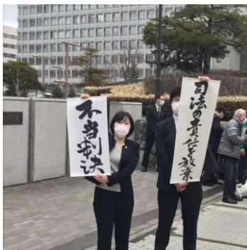
判決後の原告団（札幌地裁前、2021年3月29日）

国が生活保護費の支給額を引き下げたのは生存権を認め た憲法に違反するとして、北海道の受給者らが処分の取り 消しを求めた裁判で札幌地裁は3月29日、原告の請求を棄 却しました。