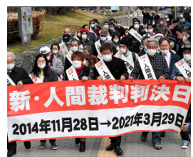
生活保護引き下げ訴訟、原告側の請求を棄却 札幌地裁 朝日新聞デジタル 3/29(月) 14:06