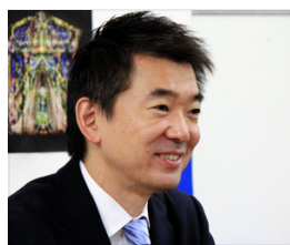
橋下徹氏 グローバルダイニングの請求額104円に疑問「応援…」 デイリースポーツ 3/29(月) 11:29