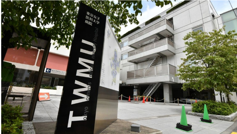
東京都新宿区にある東京女子医大病院。内科を中心に大量の医師が退職した

東京女子医科大学の3つの付属病院で、100人を超える医師が3月までに一斉退職したことが、独自取材でわかった。辞めた分の補充が間に合わず、各病院は大幅に医師が減少した状態で、4月からの新年度を迎えているという。新型コロナ第4波を迎える中、東京の医療体制にも影響を及ぼしかねない。