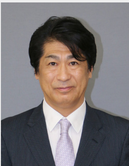
田村憲久厚生労働相

建設アスベスト（石綿）訴訟で国の責任を認める判断が確定したことについて、田村憲久厚生労働相は18日の閣議後の記者会見で、「重く受け止め、国が責任があると認められた原告の方々に対して深くおわび申し上げる」と改めて謝罪した。